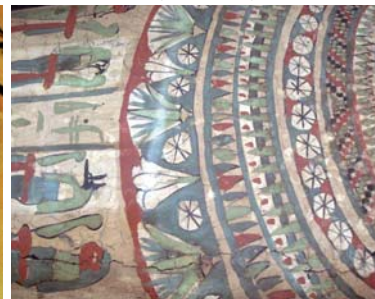
Milano, Museo archeologico, sezione egizia