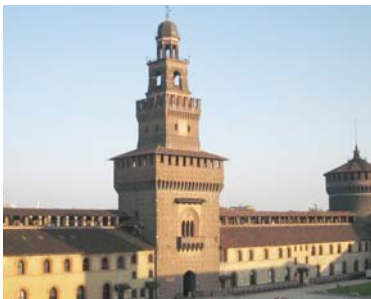
Milano, Castello sforzesco