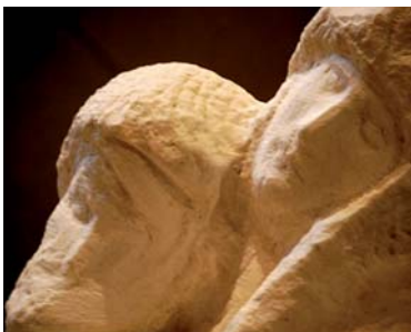
Milano, Castello sforzesco, Pietà Rondanini , particolare