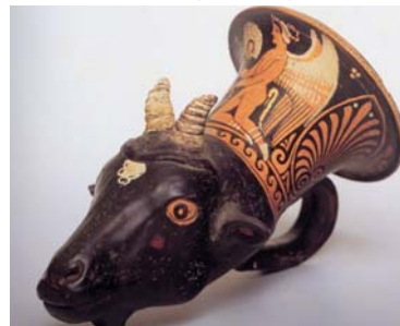
Milano, Museo archeologico, sezione greca