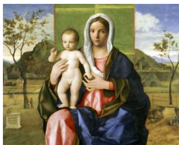
Giovanni Bellini, Madonna col bambino