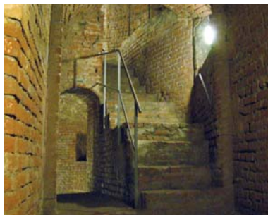
Milano, Castello sforzesco