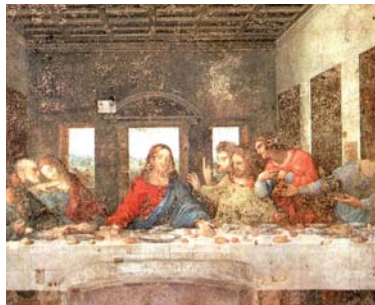
Leonardo da Vinci, Ultima cena